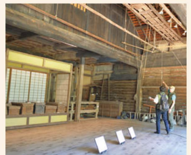
《特別公開》旧船越の舞台

五箇山から移築された古民家を背景に、五箇山の伝統芸能を披露します。その他、講演や観光案内も開催。