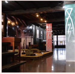
「ダムに沈んだ村」展示の様子

旧山田家住宅は富山県南砺市桂から移築されました。長らく6戸の人々が暮らす小さな集落でしたが、昭和45年に廃止され、現在はダムの底となっています。今回の展示では、今はなき桂集落で使用された貴重な民具を紹介。