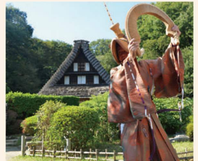
世界遺産五箇山がやってくる!

こどもから大人まで参加可能。入賞者にはオリジナルベーゴマをプレゼント! ※賞ベーゴマも有り