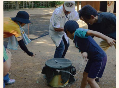
ベーゴマ大会「第5回民家園杯」

美味しいお菓子とお抹茶を古民家で召し上がれます。作法にとらわれず、お気軽にお楽しみください。