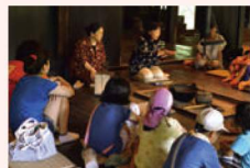
みちのくむかし語り