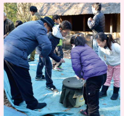
ベーゴマ大会「第10回民家園杯」

子どもから大人まで、当日自由に参加できる大会。貸ベーゴマ・紐もあるので、お気軽にご参加いただけます。