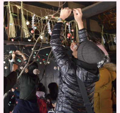
まゆ玉飾り-小正月モノヅクリ-