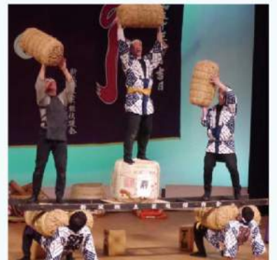
50周年記念伝統芸能公演「祝」 開園50周年のお祝いとして、民家園を支えてくださった皆様のために市内に伝わる「祝」の伝統芸能を披露します。 写真：新城囃子曲持