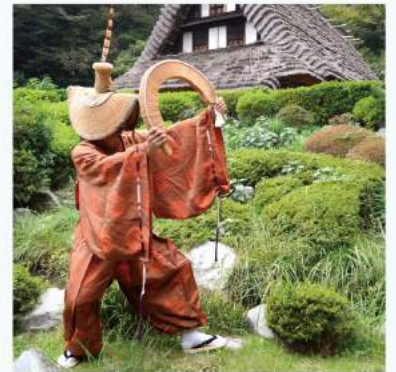
五箇山へちよっこし寄ってかさい 民家園にある合掌造り古民家の故郷である、富山県南砺市五箇山の伝統芸能や講座などを行います。