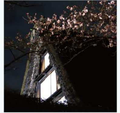
夜の民家園～古民家と桜のライトアップ～ 暗闇に照らし出される古民家と桜の幻想的な姿をお楽しみください。