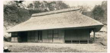
設立のきっかけとなった旧伊藤家住宅