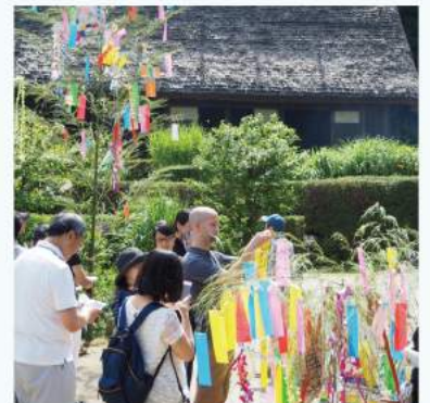
民家園の七夕-飾り作りと飾りつけ体験- 折り紙で飾りを作って、大きな竹に飾りつけをします。当日に科学館で配布するオリジナル短冊持参でご参加の方には、ミニ笹をプレゼント。