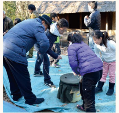
ペーゴマ大会「第13回民家園杯」 子どもから大人まで、当日自由に参加できる大会。貸ペーゴマ・紐もあるので、お気軽にご参加いただけます。