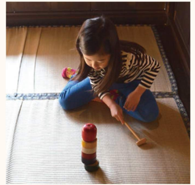
民家園で福招き! -お正月をあそぶ- 新年を祝う様々な催しを行います。日本らしいお正月をお楽しみください。