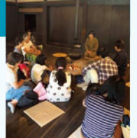
万華鏡のむかし話

●時間：13時30分～14時 / 14時30分～15時 (各約30分) ●当日参加自由 ●料金：入園料のみ