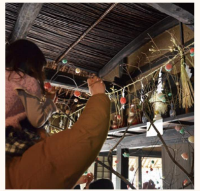
まゆ玉飾り-小正月モノヅクリ- 豊作を願う小正月行事の実演とまゆ玉飾りの体験を行います。