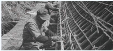
屋根下地を結ぶ職人たち