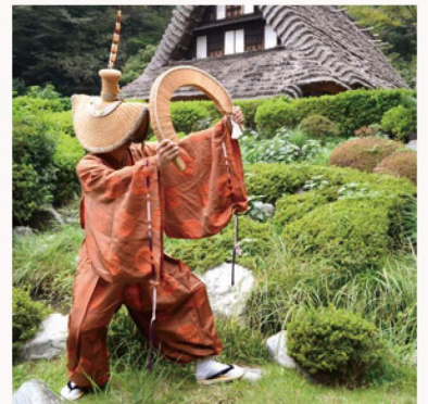
五箇山へちよっこし寄ってかっさい 民家園にある合掌造り古民家の故郷である、富山県南砺市五箇山の伝統芸能と茶菓を体験できます。

こどもまつり 4月29日(金祝)～5月1日(日) 5月3日(火祝)～5月5日(木祝) 期間中の催事情報は、表紙を参照