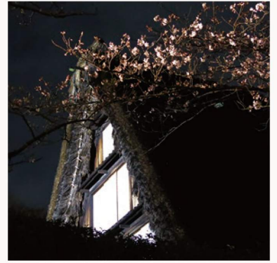
夜の民家園～古民家と桜のライトアップ～ 暗闇に照らし出される古民家と桜の幻想的な姿をお楽しみください。