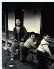
清宮家の子供たち