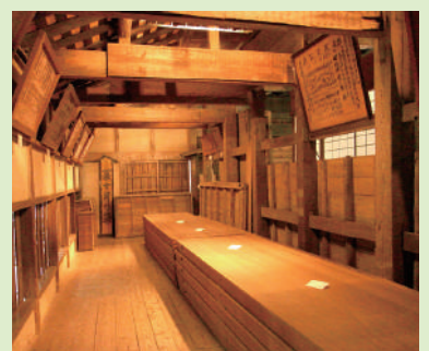
《特別公開》旧船越の舞台 廻り舞台を持つ、江戸時代末の本格的な歌舞伎舞台の内部を期間限定で、解説付きで公開します