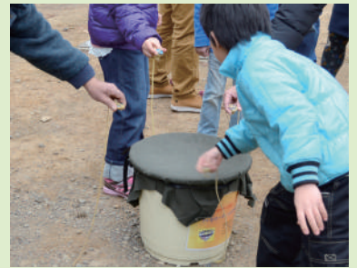
ベーゴマ大会「第2回民家園杯」 子どもから大人まで参加可能。入賞者にはオリジナルベーゴマをプレゼント! ※貸ベーゴマも有り