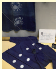
ミニ展示「藍T Vol.7 藍染Tシャツのミリオク」

伝統工芸館では、随時藍染め体験を受付しています。詳細はお問い合わせください。 TEL: 044-900-1101