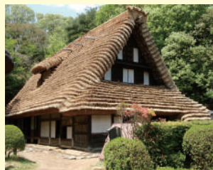
南砺市から移築された旧江向家

旧江向家住宅は富山県南砺市から移築されました。いわゆる五箇山の合掌造り民家で、国の重要文化財に指定されています。今回の展示では、紙漉き用具など、現地で使用された貴重な民具を紹介します。