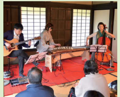
新緑を彩る和洋の調べ・こども箏体験 古民家に響く箏、ピアノ、チェロの美しい音色をご堪能ください。事前申込制のこども箏体験も開催します