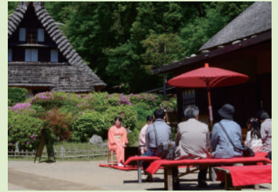
お茶会 全3日間、それぞれ異なるお点前が披露されます。作法にとらわれず、お気軽にお抹茶をお楽しみください