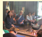
お国言葉で語りっこ